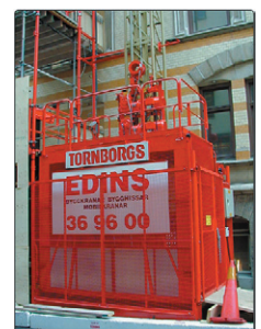
Bygghissar Kuggstång och hydrag