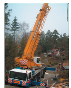
Mobilkranar Lyftkapacitet 10-250 ton