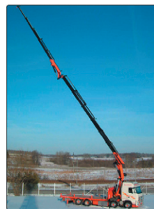
Kranbilar Lyfter 33 meter